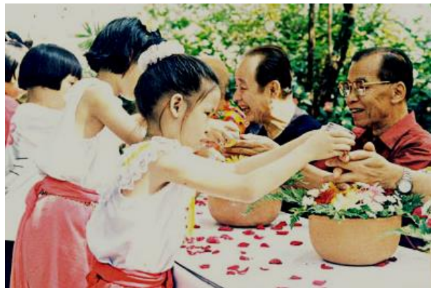
ภาพที่ ๓๐ ภาพ ช การถ่ายทอดขนบธรรมเนียมประเพณี โดยผ่านสถาบันครอบครัว สถาบันการศึกษา และการจัดกิจกรรมตามประเพณีต่างๆ