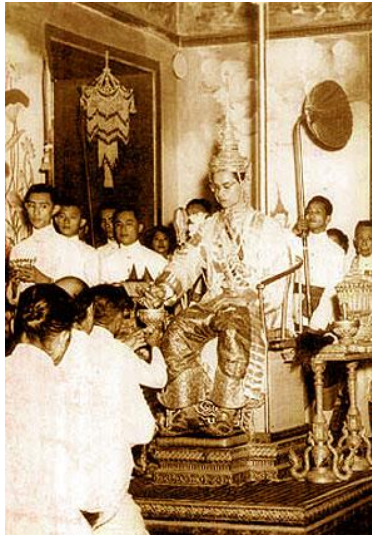
ภาพที่ ๒๖ ภาพ ง การฟื้นฟูขนบธรรมเนียมประเพณีไทย