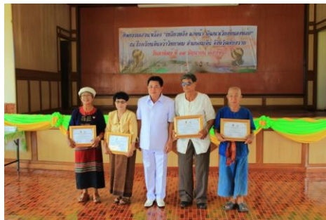
ภาพที่ ๒๔ ภาพ ข การเสริมสร้างปราชญ์ท้องถิ่น (การยกย่องประกาศเกียรติคุณครูภูมิปัญญา) (ที่มา : ศูนย์วัฒนธรรมเฉลิมราชเวียงหนองล่อง. ๒๕๕๙)