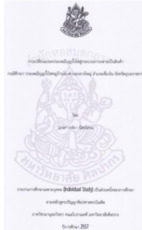
ภาพที่ ๒๓ ภาพ ก รายงานการค้นคว้าวิจัย