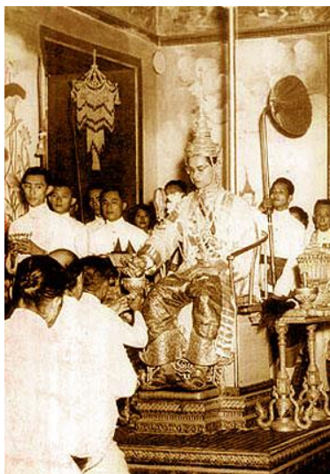
ภาพที่ ๒๖ ภาพ ง การฟื้นฟูขนบธรรมเนียมประเพณีไทย