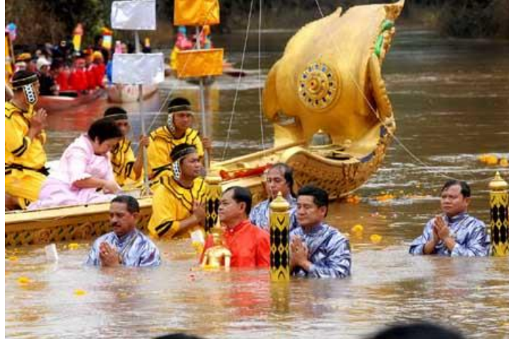
ภาพที่ ๒๑ ประเพณีอุ้มพระดำน้ำ จังหวัดเพชรบูรณ์ (ที่มา : https://www.google.com )