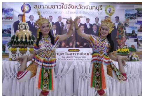
ภาพที่ ๒๗ ภาพ จ การการเผยแพร่แลกเปลี่ยนขนบธรรมเนียมประเพณีไทย