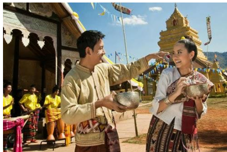
ภาพที่ ๒๕ ภาพ ค การอนุรักษ์ประเพณีไทย (วันสงกรานต์)