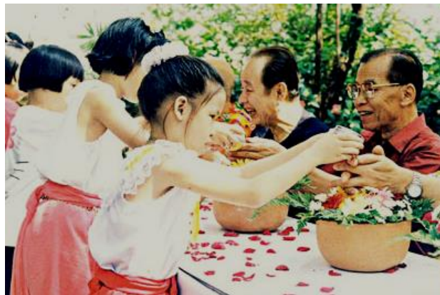
ภาพที่ ๓๐ ภาพ ช การถ่ายทอดขนบธรรมเนียมประเพณี โดยผ่านสถาบันครอบครัว สถาบันการศึกษา และการจัดกิจกรรมตามประเพณีต่างๆ