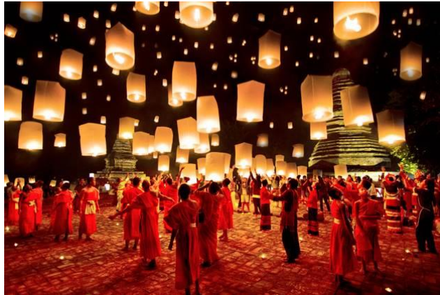
ภาพที่ ๒๙ ภาพ ช การส่งเสริมกิจกรรมขนบธรรมเนียมประเพณีของชุมชนต่างๆ