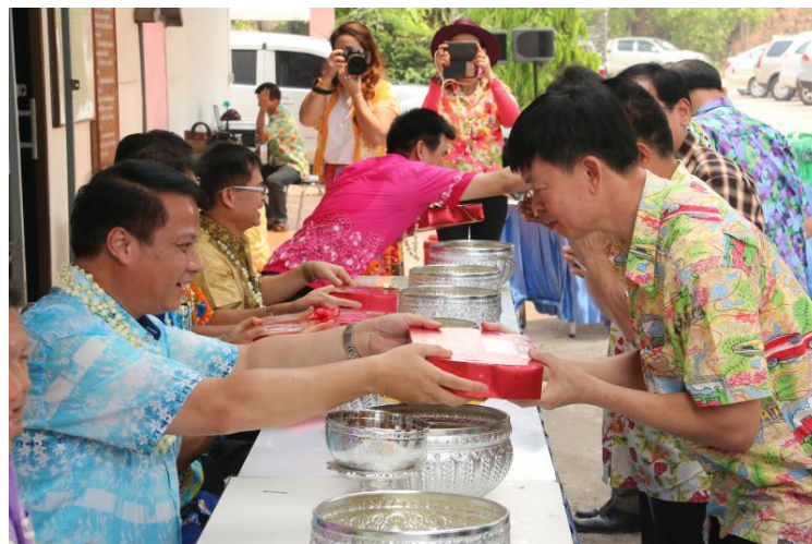
ภาพที่ ๒๒ ขนบธรรมเนียมประเพณีไทย รดน้ำดำหัว ขอพรผู้ใหญ่ วันสงกรานต์