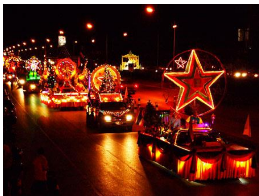
ภาพที่ ๒๘ ภาพ ฉ การพัฒนาขนบธรรมเนียมประเพณี ให้เหมาะสมกับยุคสมัย