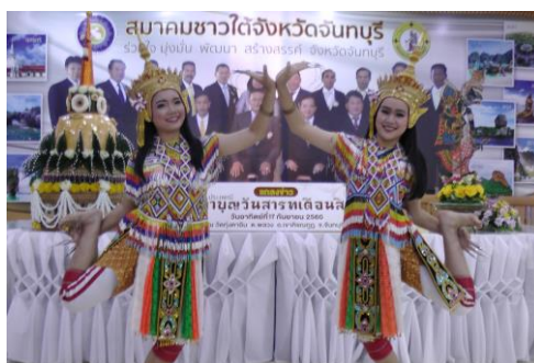
ภาพที่ ๒๗ ภาพ จ การการเผยแพร่แลกเปลี่ยนขนบธรรมเนียมประเพณีไทย